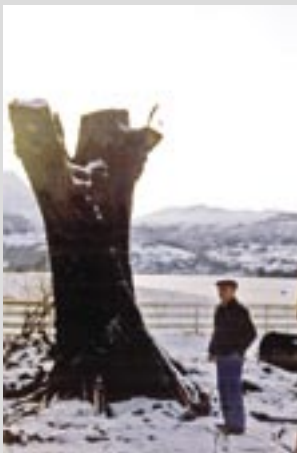
Bilde til venstre: Almen på plass igjen.