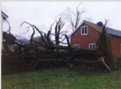
Orkanen i 1992 herjet med almen i Volda.