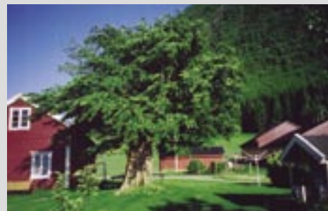
Bilde over: Almen slik den framstår i dag.